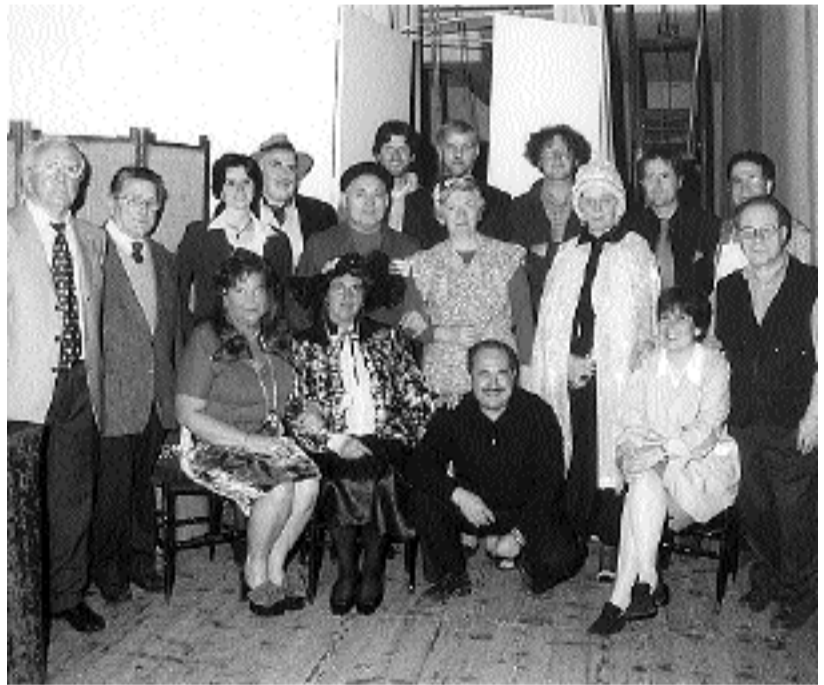
FILODRAMMATICA La compagnia teatrale Juventus Nova del rione leccese di Belleo

Il pubblico ha sottolineato con viva partecipazione i tanti colpi di scena