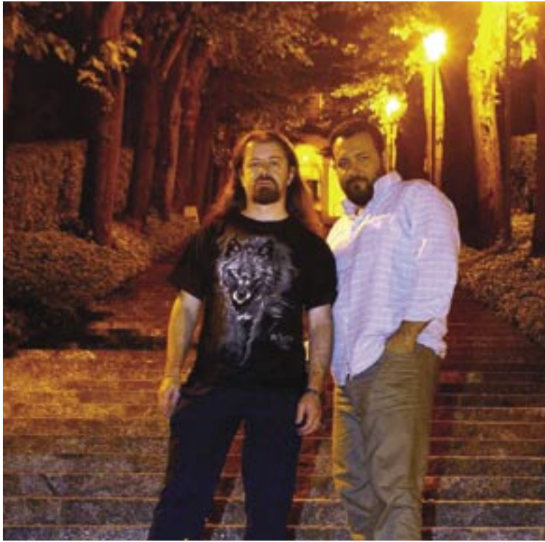
Il nonno fondatore dei Luf e il socio di minoranza