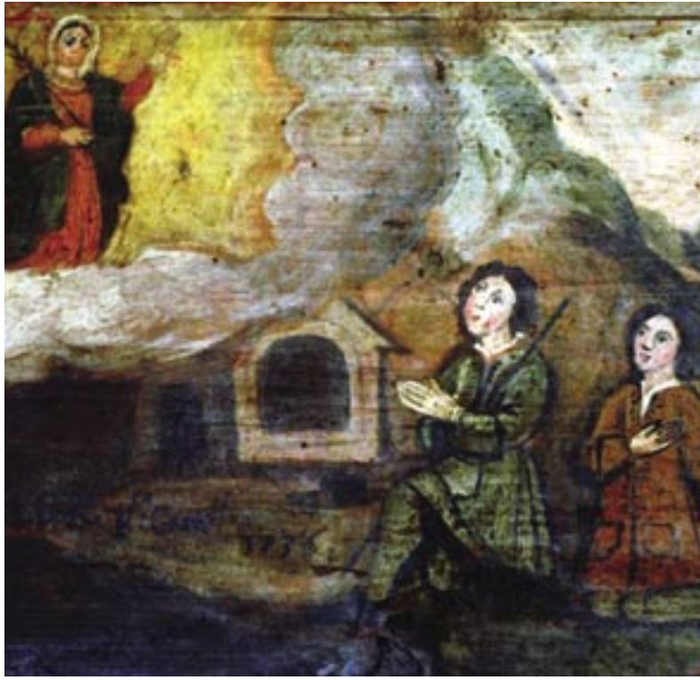
Piccola donna piccola luna Tierra Bomba